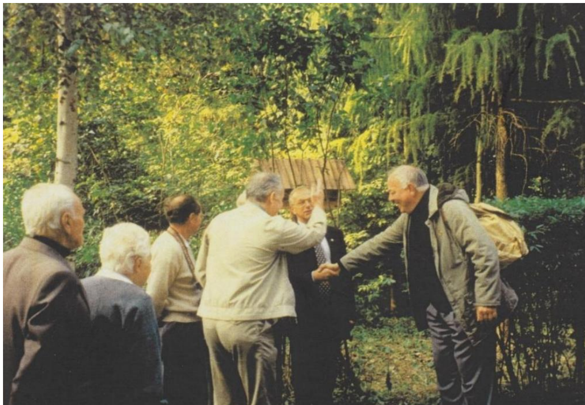
Zdjęcie archiwalne z otwarcia szlaku im. PTK w dniu 18 września 1999 r. Na zdjęciu przecięcie symbolicznej wstęgi otwierającej szlak.

Więcej informacji oraz galeria zdjęć znajdują się na stronie Komisji Turystyki Pieszej Oddziału Miejskiego PTTK w Lublinie – ktp.lublin.pttk.pl