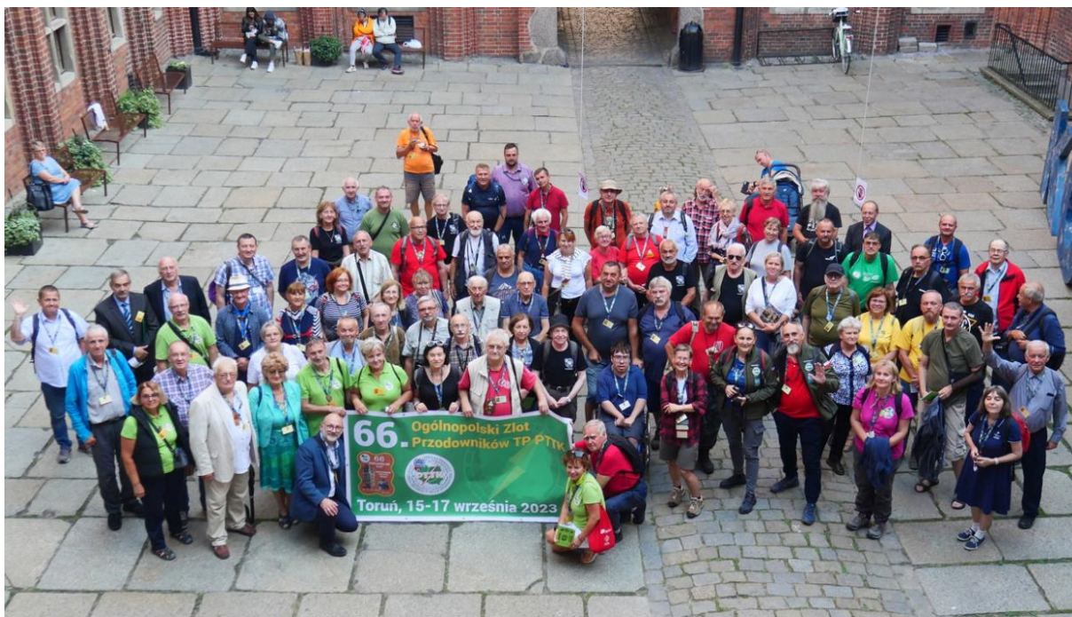
UCZESTNICY 66 OGÓLNOPOLSKIEGO ZLOTU PTP NA DZIEDZIŃCU RATUSZA W TORUNIU