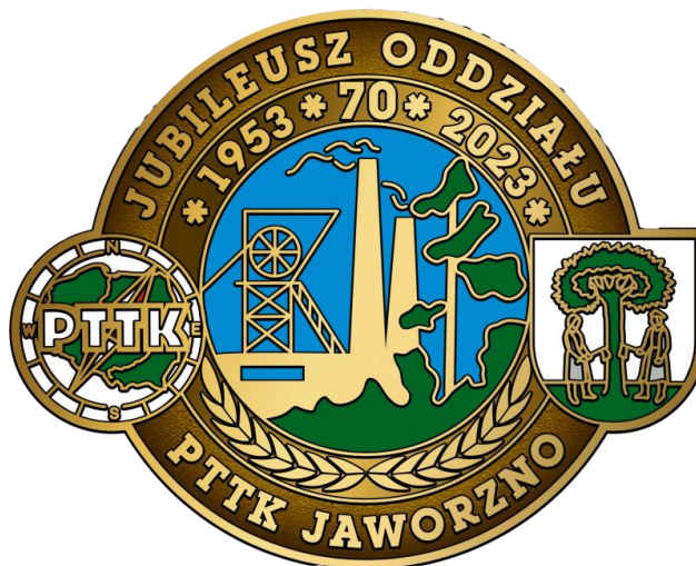
Fot. 4. Odznaka Jubileuszowa 70 lat PTTK Jaworzno 1953-2023. Projekt firmy POL-MET wg koncepcji Zarządu Oddziału PTTK Jaworzno.

Akcentem wspólnym dla Oddziałowej Komisji Turystyki Pieszej i Oddziałowej Komisji Krajoznawczej stała się wystawiona na kolejnej specjalnie na ten cel przygotowanej tablicy galeria naszej Regionalnej Odznaki Krajoznawczej PTTK Jaworzno „Miłośnik Ziemi Jaworzniczej”. Wspólny akcent to okres, kiedy Komisja Krajoznawcza w oficjalnej formie nie funkcjonowała przy oddziale, a promocją i weryfikacją ROK „MZJ” zajmowali się weryfikatorzy z Terenowego Referatu Weryfikacyjnego OTP PTTK.