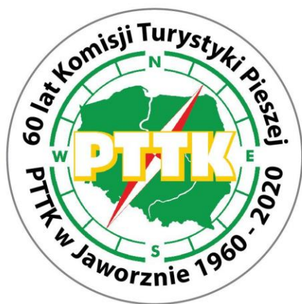
Fot. 13. Logo jubileuszowe KTP PTTK Jaworzno wykonane w roku 2020 przez firmę Badge4u z Jaworzna.