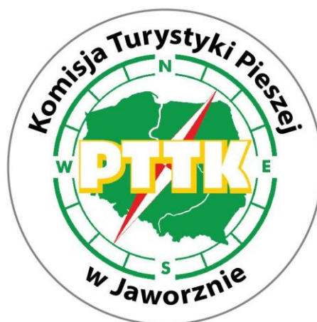
Fot. 14. Logo KTP PTTK Jaworzno wykonane w roku 2020 przez firmę Badge4u z Jaworzna.