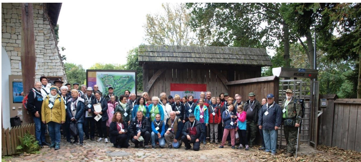
Zdjęcie grupowe uczestników Złazu.