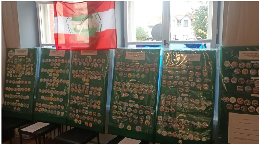
Fot. 3. Wystawa historycznych znaczków rajdowych KTP PTTK Jaworzno, fot. M. Sarna

eksponować znaczek dokładnie z każdego rajdu, który odbył się pod banderą Komisji. Możliwość mamy taką tylko dlatego, że sumiennie na każdy rajd znaczki są zamawiane, a zaprzyjaźniona firma „Badge4u” z Jaworzna miesiąc w miesiąc je dla nas projektuje i wykonuje. W uznaniu zasług z tego tytułu, na wniosek ZO PTTK Jaworzno firma ta została wyróżniona Dyplomem Honorowym ZG PTTK „Za pomoc i Współpracę” bo warte jest zaznaczenia jeszcze to, że od okazji – do okazji, znaczki wykonuje się także dla innych Komisji