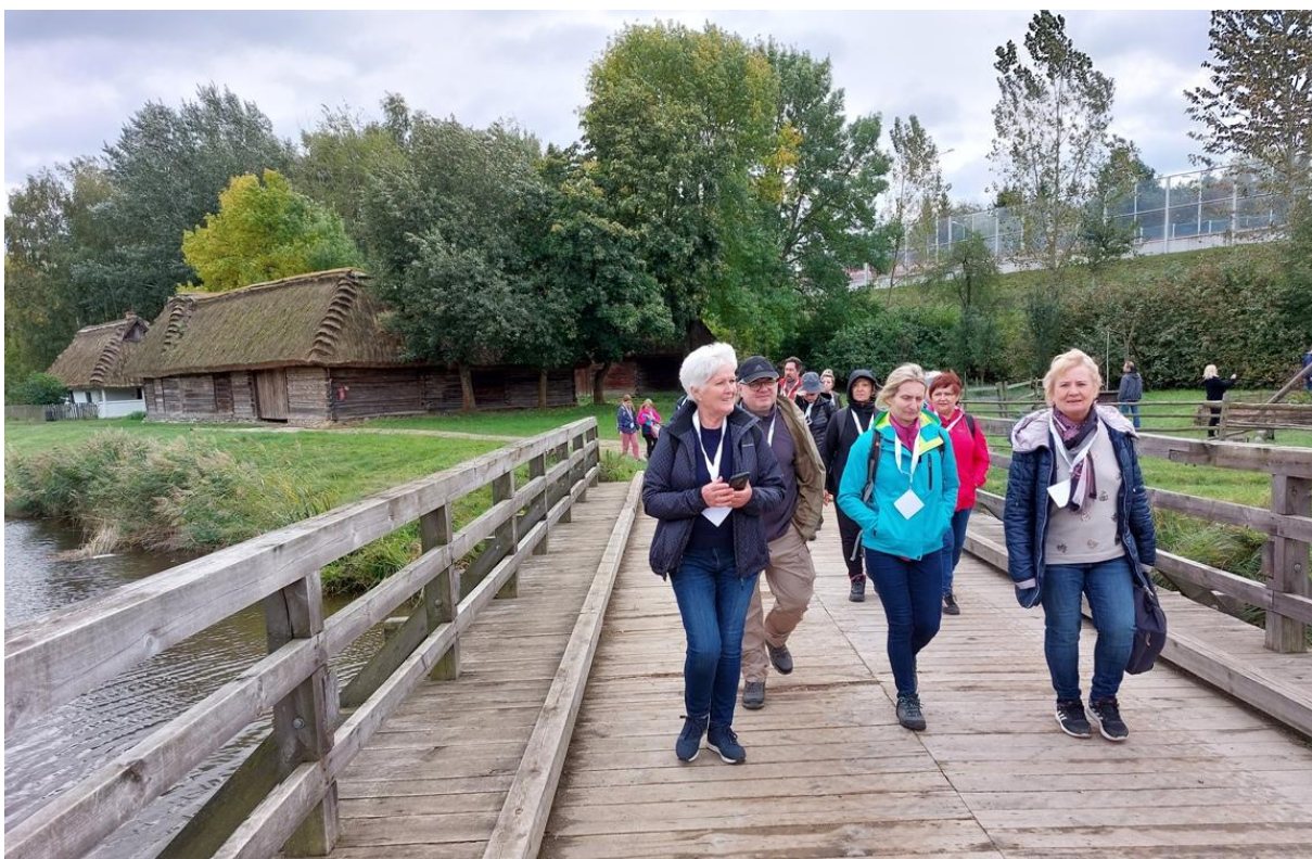
Uczestnicy Złazu w sektorze "Powiśle".