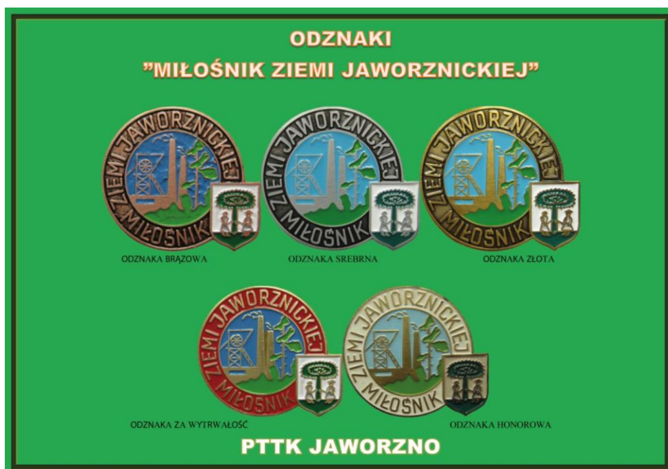
Fot. 5. Tablica z galerią Regionalnej Odznaki Krajoznawczej PTTK Jaworzno „Miłośnik Ziemi Jaworznickiej”, przygotował Maciej Berny, Komisja Krajoznawcza PTTK Jaworzno.

Skoro przy temacie odznak jesteście to warto tu wspomnieć trud członków Zarządu Oddziału włożony w zaprojektowanie i wyemitowanie okolicznościowej „blachy” wręczanej jako pamiątkę udziału każdemu z zaproszonych na jubileusz gości. Wspominam ją także dlatego, że podobnie jak wymieniona wcześniej Odznaka Jubileuszowa „60 Lat Komisji Turystyki Pieszej PTTK Jaworzno 1960-2020” także i ta kształtem i symbolami nawiązuje do ww. Odznaki „Miłośnik Ziemi Jaworznickiej”.