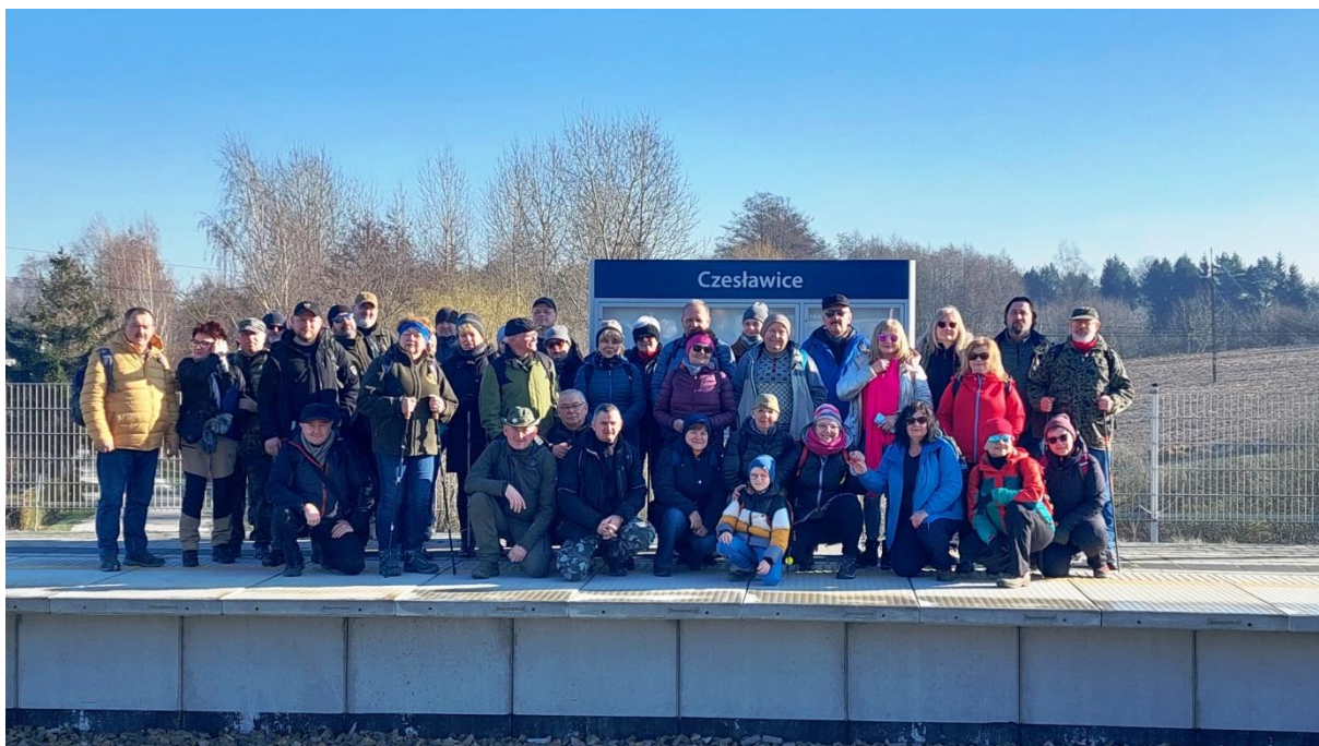
Uczestnicy XVIII Lubelskiego Zlotu Przewodników Turystyki Pieszej na stacji Czesławice – początek trasy