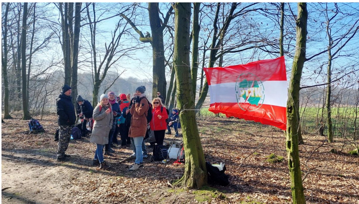
Uczestnicy Zlotu w oczekiwaniu na ognisko