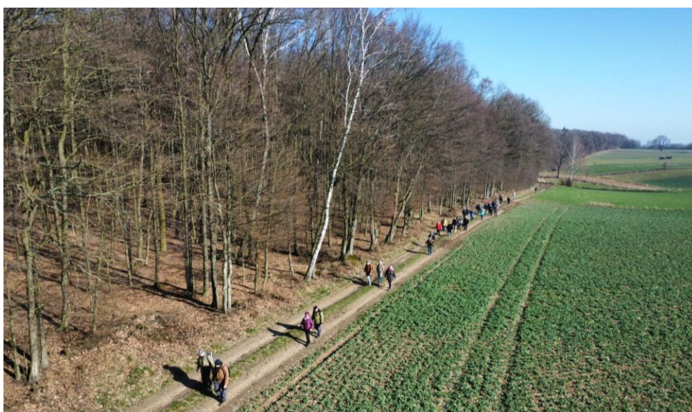
Uczestnicy XVIII Lubelskiego Złotu Przodowników Turystyki Pieszej – ujęcie z drona