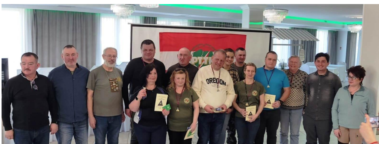
Nowo mianowani Piechurzy tuż po ślubowaniu