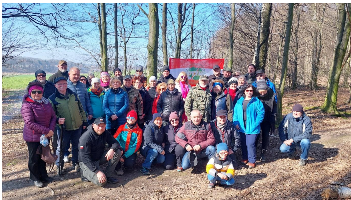
Pamiętkowa fotografia uczestników Zlotu w terenie