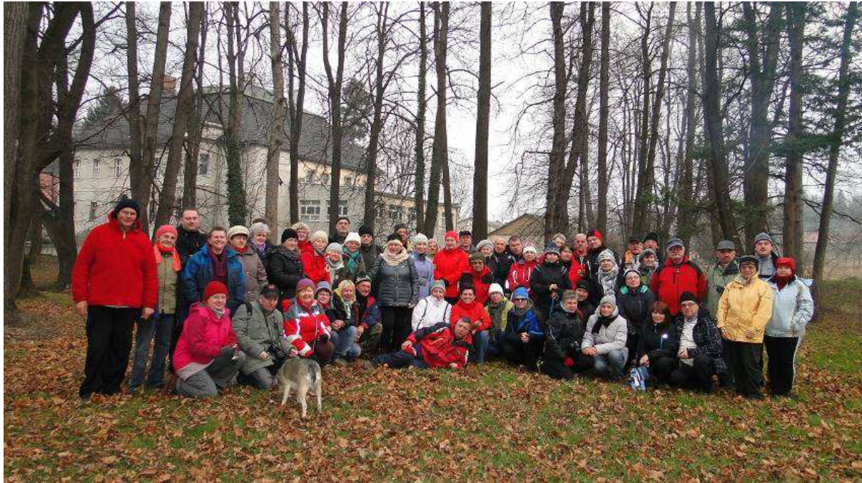
Turyści przed pałacem w Bukowcu

W niedzielę 30 listopada 2014 r. Oddział PTTK „Sudety Zachodnie” w Jeleniej Górze wraz z Karkonoską Pracownią Krajoznawczą przy Związku Gmin Karkonoskich zaprosili turystów na 44. wycieczkę Rajdu na Raty. Jest to już ostatnia wycieczka przed zakończeniem tegorocznego sezonu turystycznego, który zaplanowano na pierwszą niedzielę grudnia.