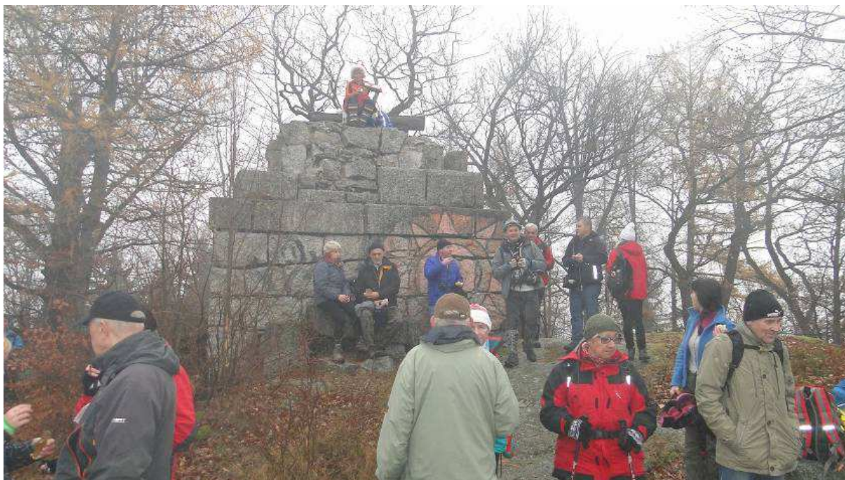
Mgła na Witoszy.