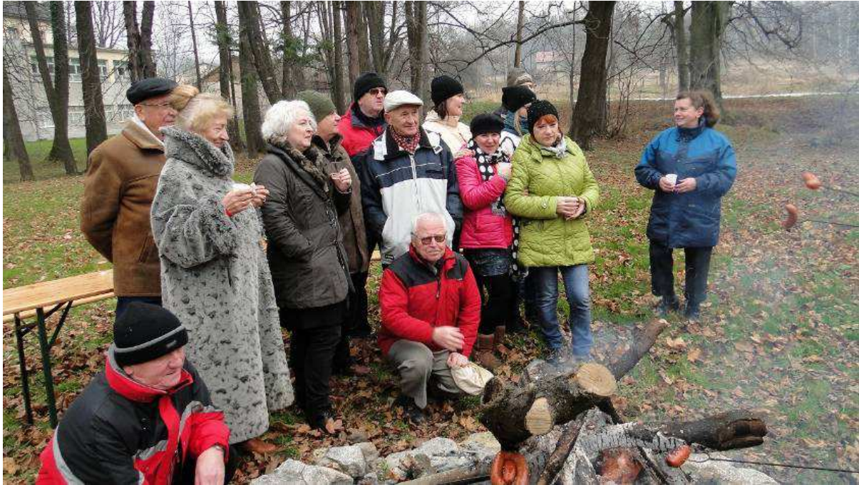
Nie mogło zabraknąć ogniska

W salach księżycowej i słonecznej zwiedzający pałac zapoznali się z wystawą przybliżającą życie Redenów, dawnych właścicieli tego obiektu. Oczywiście w tak krótkim czasie nie jest możliwe przestudiować dwadzieścia plansz, więc po wysłuchaniu skróconej wersji tego co zawarto w opisach zaprosiłem wszystkich do kolejnych wizyt tak by mogli jeszcze raz, spokojnie przyjrzeć się zgromadzonym zdjęciom i planom. Na koniec turyści zeszli do piwnic pałacowych i dowiedzieli się w jaki sposób w dawnych czasach można było niepostrzeżenie wymknąć się, wykorzystując tajne przejście prowadzące przez szafę z sekretariatu, właśnie do piwnicy i dalej do parku.