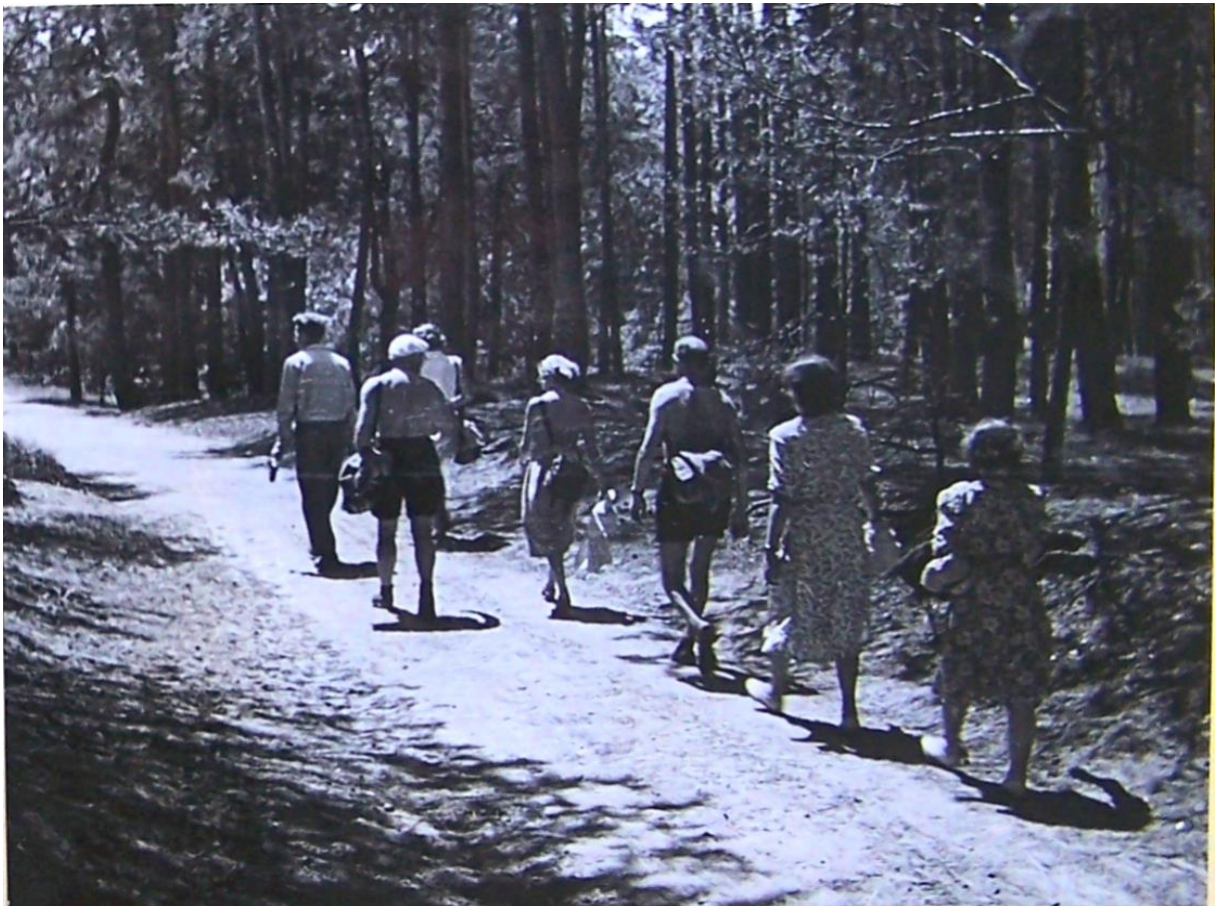
Wycieczka do Lasów Sękocińskich prowadzi Stanisław Petrek