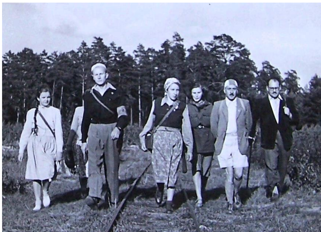
Wycieczka do Nadarzyna Fot. Tadeusz Maczubski Kronika Oddziału Stołecznego PTTK im. Aleksandra Janowskiego