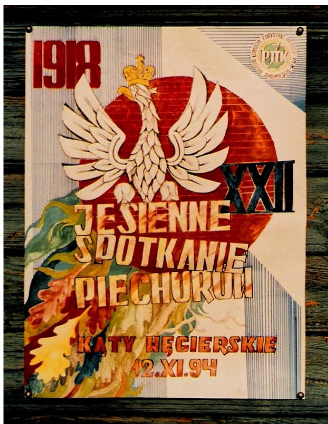
Plakaty z lat 1994 i 1996

W miarę upływu lat i zmian politycznych w kraju rajd odbywał się pod pełną nazwą JESIENNE SPOTKANIE PIECHURÓW W ROCZNICĘ ODZYSKANIA NIEPODLEGŁOŚCI. Aktualne wydanie Szuflady Kolekcjonera obfite niż zwykle poświęcamy symbolice tej imprezy prezentując wykonane w rozmaitych, zachowane plaketki, znaczki, plakaty i pieczętunki rajdowe.