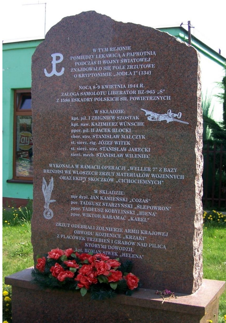
Obelisk pola zrzutowego „Jodła –I” (130) W Grabowie nad Pilicą.

Po zwiedzeniu Grabowa nad Pilicą zachęcamy do dalszej wędrówki czerwonym szlakiem turystycznym przez południowe Mazowsze. Czerwonemu szlakowi turystycznemu temu nadano imię Witaliusza Demczuka inicjatora oraz twórcy znakowanych tras turystycznych w Puszczy Kozienickiej. Długość szlaku 66 km. Jest to główny szlak pieszy Puszczy Kozienickiej i Stromieckiej, aby w pełni zapoznać się z jego krajoznawczymi walorami warto zaplanować przebycie go w trakcie trzydniowej pieszej wędrówki. Szlak prowadzi: od stacji PKP Warka - PKP Grabów nad Pilicą – Paprotnię - Studzianki Pancerne – Grabnowolę – Głowaczów – Brzuzę - "Przejazd" rezerwat Zagożdżon” - Stoki - rezerwat Ponty- rezerwat "Ciszek"- do stacji kolejowej Lesiów pod Radomiem. Szlak wiedzie przez piękne zróżnicowane pod względem drzewostanu tereny Puszczy Stromieckiej i Kozienickiej z widokami na malowniczą dolinę Radomki. Wędrując tym szlakiem zobaczymy również zabytki w Brzozie, Grabowie nad Pilicą i Warce, pomnik-mauzoleum w Studziankach Pancernych oraz niezapomniane widoki na doliny Radomki i Pilicy. W malowniczych ostępach leśnych można spotkać tu dziki, sarny, łosie, lisy, na polach zające i kuropatwy. Szlak poprowadzono tak by pokazać piękno tych stron, przyrodę, zabytki i miejsca związane z dramatycznymi wydarzeniami wpisanymi w historię południowej części Mazowsza.