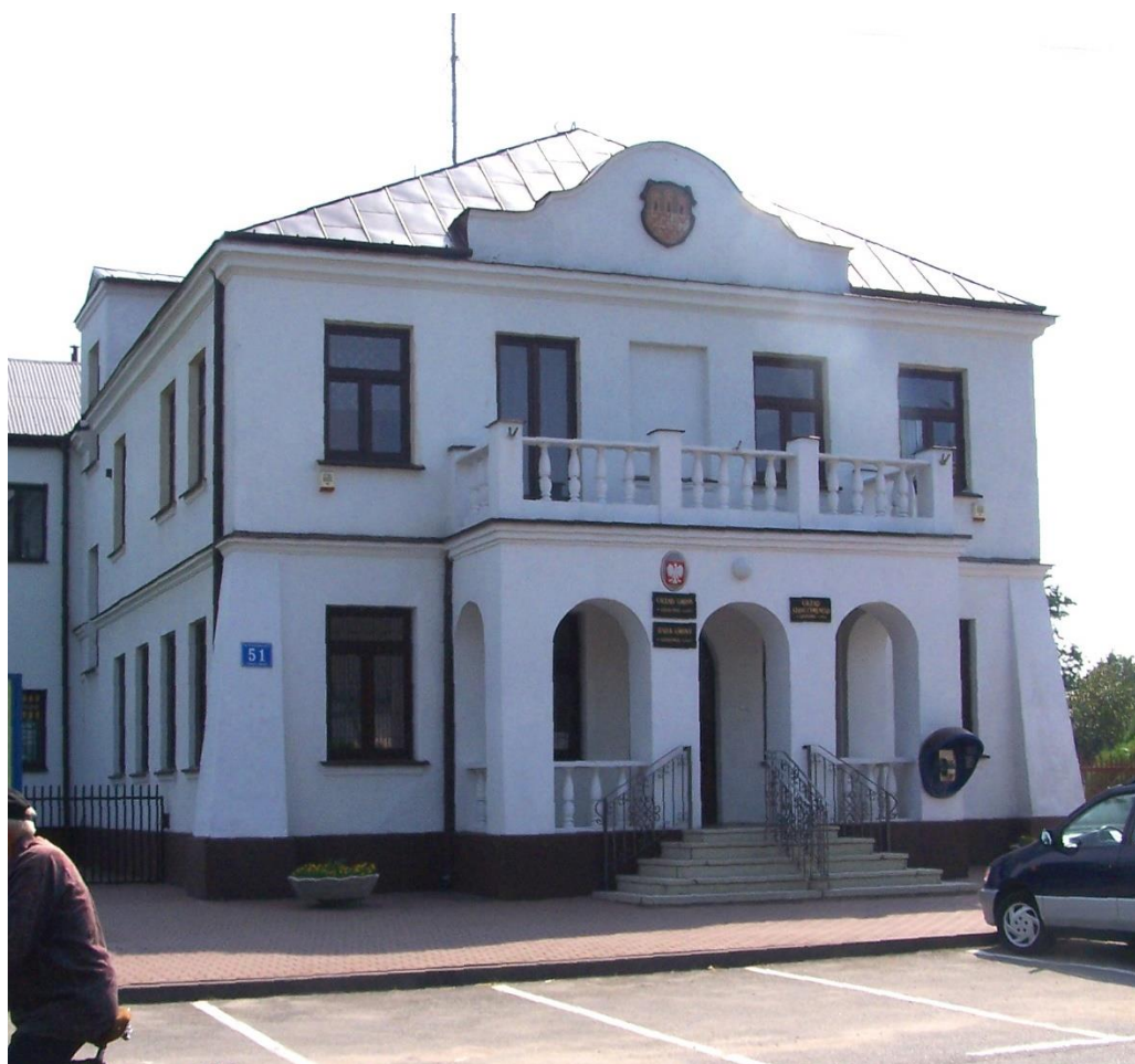
Urząd Gminy w Grabowie nad Pilicą.

25-26.10. 1914, w tak zwanej Bitwie pod Lipą Na wielu cmentarzach z I Wojny Światowej - chowano obok siebie walczących po obu stronach frontu, żołnierzy których połączył ten sam wojenny los.